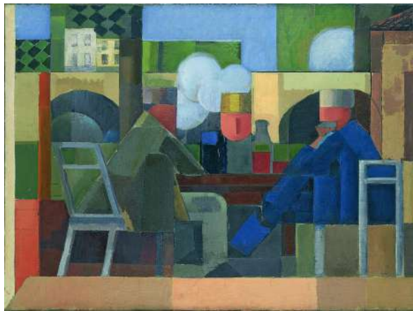
Bord de Seine