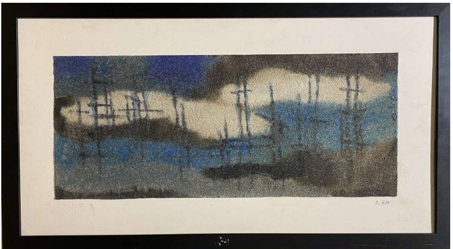
Paysage abstrait - Peinture sur sable