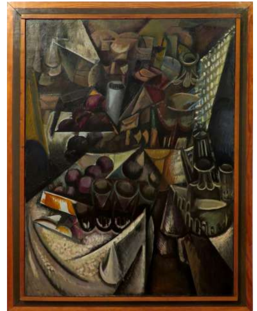
Le restaurant Hubin